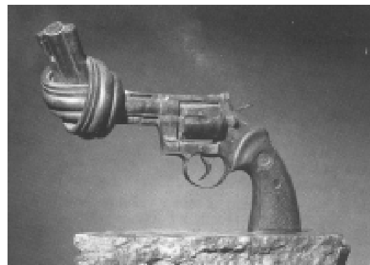
Pequena réplica da escultura