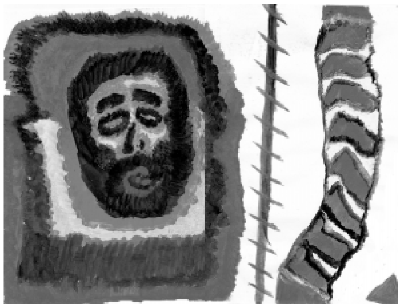
V., Fraqueza e Força, 1999